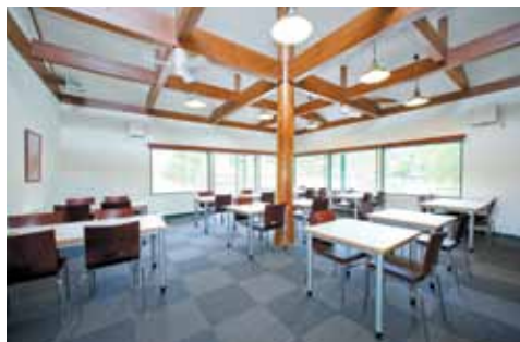
■ ダイニング：広く明るなお食事スペース。窓越しにドッグランが見渡せます。