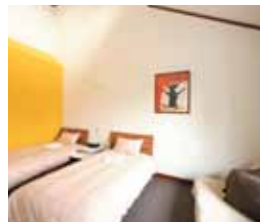
■ 2F客室：ゆったりした寝室エリア。