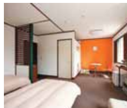
■ 1F客室：全室バス+トイレ完備のお部屋です。

本館の客室はファミリータイプの洋室で4名様までご宿泊できます。愛犬と気軽にお過ごしいただけるシンプルなインテリアです。2F客室にはロフトをご用意しています。