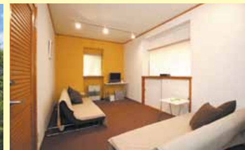
■ 1Fリビング：ソファベッドになっているので、人数が多い時には寝室としても利用可能です。