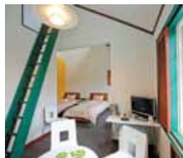
■ 2Fリビング：語らいのスペースをご用意しました。