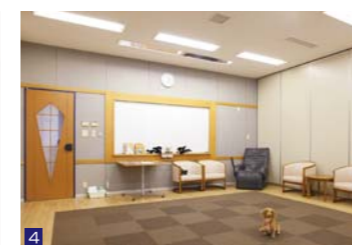
4 愛犬と楽しく過ごせるドッグプレイルーム。