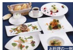
お料理の一例 お食事は地元の新鮮な素材を活かした、創作料理の数々をご用意。