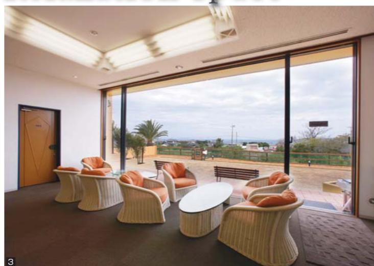
3 目の前に広がる館山湾を望みながら寛げるラウンジ。ドッグランを走り回る愛犬を窓越しから眺められます。

お部屋は全室スタンダード・オーシャンビュー。 愛犬も喜ぶ専用ドッグランを2タイプ完備。