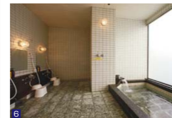
6 広いお風呂で寛いでいただけるよう、貸切風呂も完備しています。(サウナ付)