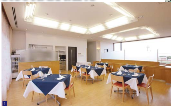
1 広く明るい1Fレストラン。ラウンジを挟んだ窓越しには、ドッグランが見渡せます。