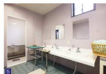
5 ワンちゃん用トリミングルーム。