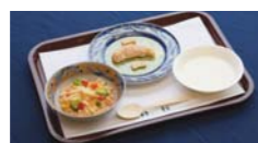
特別メニューとしてワンちゃんお気に入りのプレートもご用意。