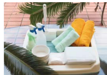
ワンちゃん用のアメニティグッズ。