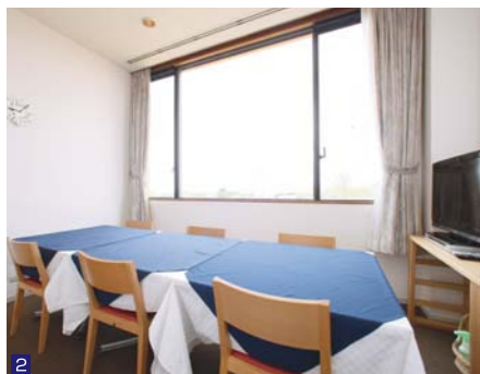
2 個室はお知り合いの方々でのディナーなど、プライベートなご利用をお過ごしいただけます。(要予約)